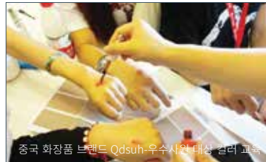
중국 화장품 브랜드 Qdsuh-우수사원 대상 컬러 교육

다양한 분야에서 컬러에 대한 관심이 높아지고 있습니다. 단순한 컬러도입이 아닌 퍼스널컬러로 해석한 컬러 마케팅을 기획하실 수 있도록 컬러즈가 함께 하겠습니다.