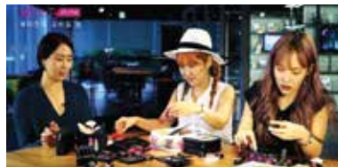
#뷰티인미 #CJ E&M #1편-퍼스널컬러 #2 편-네일편 #뷰티클래스