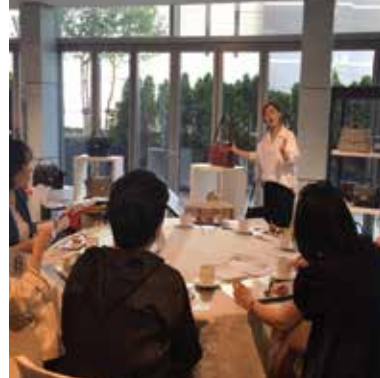
#마리아꾸르끼 #현대백화점 #VIP 스타일링 클래스 #퍼스널컬러 진단 #신제품 출시