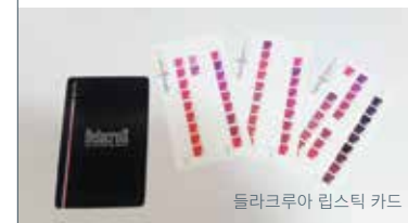
들라크루아 립스틱 카드