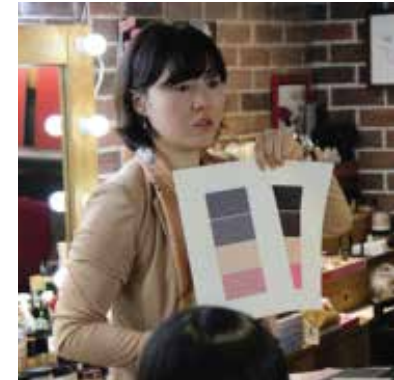
#비니하우스 #중국메이크업샵 #아티스트교육 # 퍼스널컬러특강 #메이크업시연