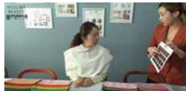
#유튜브 #뷰티유튜버 #유투루 #1:1진단