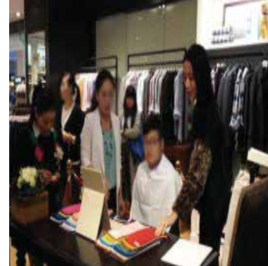
#중국 헤지스 VIP 고객행사 #퍼스널컬러 진단 #제품 추천 #스타일링 서비스 판매