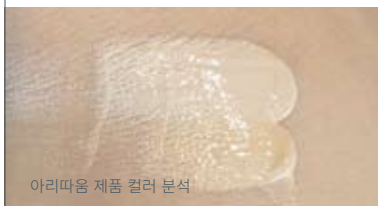
아리따움 제품 컬러 분석

컬러가 없는 곳은 없습니다. 퍼스널컬러의 관점으로 제품을 분류하여 다양한 콘텐츠를 제작할 수 있습니다. 개인에게 맞는 컬러라는 새로운 컨셉으로 고객에게 새로운 서비스를 제공해 보세요.