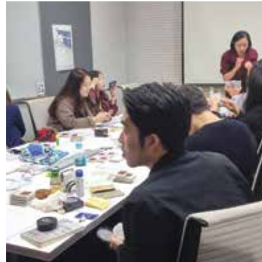
#아리따움 #대학생 서포터즈 #뷰티클래스 #컬러워크북 #소규모강의형 #컬러교육