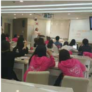
#에뛰드하우스 #뷰티존 #대학생 서포터즈 #뷰티클래스 #제품분석 #대규모강의형2 # 자가진단키트

컬러즈는 33만회원의 패션/뷰티/커뮤니티를 실현하기 위하여 컨설팅 상품 온라인 사이트 www.coloz.co.kr 를 주력으로 온.오프라인 교육, 제품개발, 컨설팅, 레퍼런스, 외부특강을 전개하며 퍼스널컬러 대중화를 선도하고 있습니다.