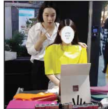
#들라크루아 #런칭이벤트 #Got Color Project # 제품분석 #판매직원교육 #카드제작 #게릴라홍보 #팝업스토어컬러진단