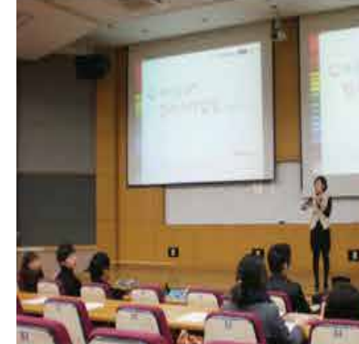
#STCO #면접스타일링 #퍼스널컬러진단 #브이존컨설팅 #젠틀맨컨설팅