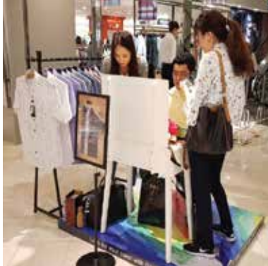
#닥스셔츠 #매장이벤트 #남성 퍼스널컬러컨설팅 #퍼스널컬러 제품 추천

컬러즈는 33만회원의 패션/뷰티/커뮤니티를 실현하기 위하여 컨설팅 상품 온라인 사이트 www.coloz.co.kr 를 주력으로 온.오프라인 교육, 제품개발, 컨설팅, 레퍼런스, 외부특강을 전개하며 퍼스널컬러 대중화를 선도하고 있습니다.