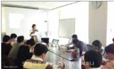
SK텔레콤 색다른 컬러마케팅 세미나